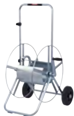
Typ WS SAF 34-100