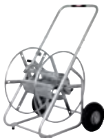
Typ WS SAF 10