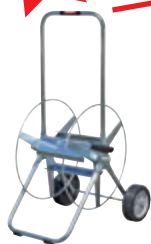
Typ WS SAF 34