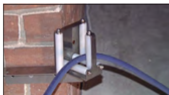
Typ SFU ES - Eck- oder Wandmontage