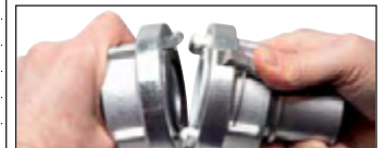
Option: mit Verriegelung