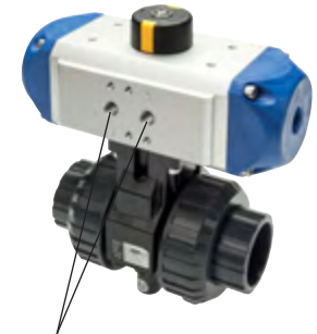
für Namurananschluss und IG

Kennzeichen der Optionen Antrieb: FKM-Dichtung .....-V