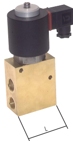
Typ für hohe Durchflusswerte

Diese Ventile werden grundsätzlich mit Spule und Stecker ausgeliefert!