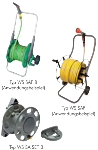
Typ WS SAF B (Anwendungsbeispiel)

Lieferumfang: Aufroller gem. Beschreibung ohne Schlauch