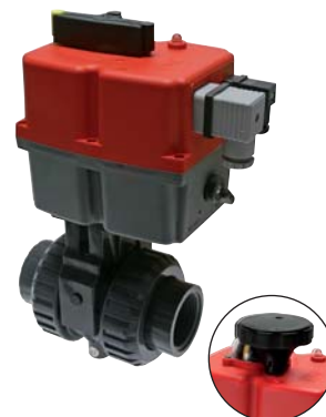
Bauform ab Antriebsgröße 3

Optional: Stellzeit 140 sek. (nur für Antriebsgröße 2) -140, „Battery Safety Return“ für Notschließung NC (Standardkonfiguration) oder Notöffnung NO (Umstellung durch Jumper) bei Spannungsausfall -BSR