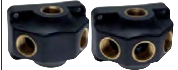
Typ mit 2 Abgängen