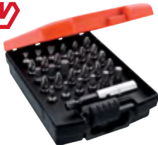
Typ Standard Bit assortment