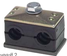
Typ Kunststoff 2 Doppelrohrschelle mit Anschweiß- und Deckplatte