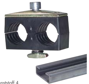
Typ Kunststoff 4 Doppelrohrschelle mit Deckplatte und Tragschienenmutter Typ KMA zum Aufbau auf C-Tragschiene TS 28 ... (Seite 368)