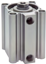
Ø 32 - 100 mm