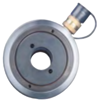
Typ RH 203