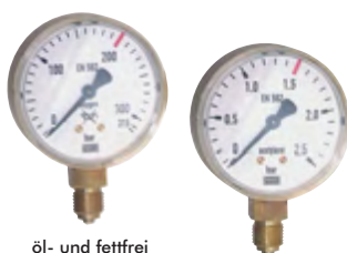
öl- und fettfrei

Alle Angaben verstehen sich als unverbindliche Richtwerte! Für nicht schriftlich bestätigte Datenauswahl übernehmen wir keine Haftung. Druckangaben beziehen sich, soweit nicht anders angegeben, auf Flüssigkeiten der Gruppe II bei +20°C.