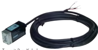
Typ mit 3 m Kabel