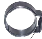
Typ mit Einlagering