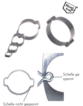
Schelle nicht gespannt