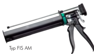
Typ FIS AM