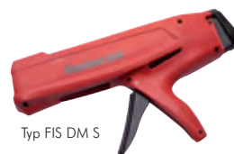
Typ FIS DM S